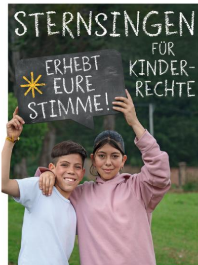
AKTION DREIKÖNIGSSINGEN 20* C+M+B+25